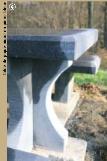
Table de pique-nique en pierre bleue

mettant au chômage un millier d'ouvriers... Aujourd'hui, la vallée constitue une aire propice à la promenade, permettant de découvrir les charmants villages qu'elle traverse, comme Bellignies, célèbre pour son industrie de marbre, Taisnières-sur-Hon ou encore Hon-Hergies. Mais savez-vous que « Hon » est l'autre nom de l'Hogneau ? Non ! Vous voyez, vous n'êtes pas encore arrivés au bout de vos surprises !